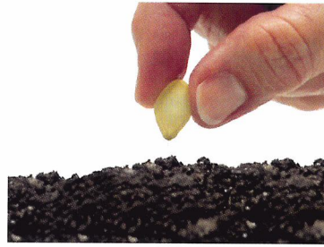
Afb. 1.50 In de moestuin leg je handmatig de boontjes op een diepte van 3 tot 4 centimeter.