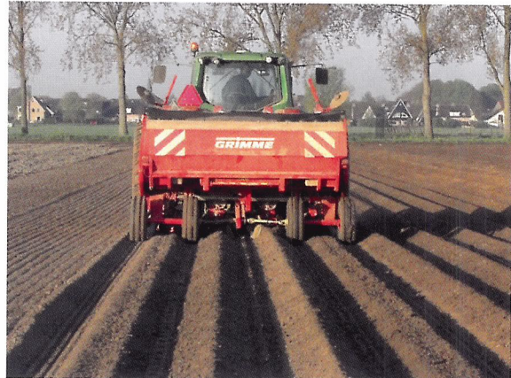
Afb. 1.48 De akkerbouwer poot aardappelen met een machine en maakt een 'rug' over de gepote aardappel.

Veel gewassen worden gezaaid, maar er zijn ook gewassen die worden gepoot. Denk aan aardappelen en bloembollen. Ook in de kwekerij wordt zowel gepoot als gezaaid. Denk aan paprika's en komkommers, zomerbloeiërs voor op het terras, groenteplanten voor in de moestuin en de verschillende soorten stekjes. Belangrijk bij planten en zaaien is dat je ervoor zorgt dat de groeifactoren voor de nieuwe planten optimaal zijn.