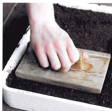
Afb. 1.53 Zaaigrond moet luchtig blijven. Daarom druk je de zaaigrond heel licht aan.