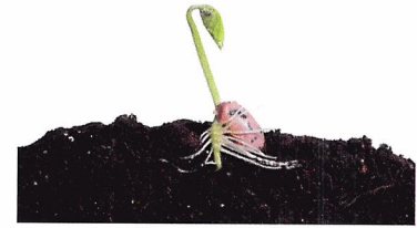
Afb. 1.51 Voor een goede kieming moet je de plant op de juiste diepte zaaien.

1.24 Hoe zaai je zonnebloempitten op een perceel?