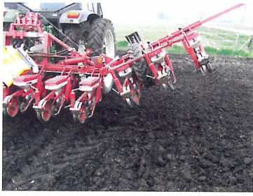
Afb. 1.49 Een akkerbouwer zaait machinaal maïs in rijen, 4 tot 5 centimeter diep, in de volle grond.