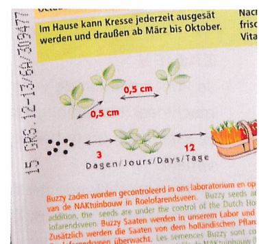
Afb. 1.54 Lees de zaai-instructie op de verpakking goed door!